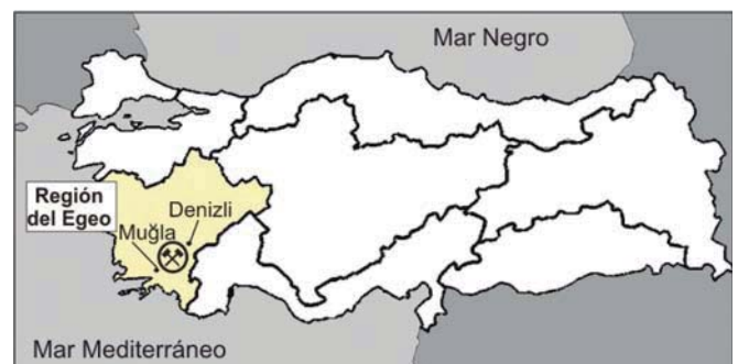
Fig. 1.- Location of the studied Classic Travertine quarry in Turkey.