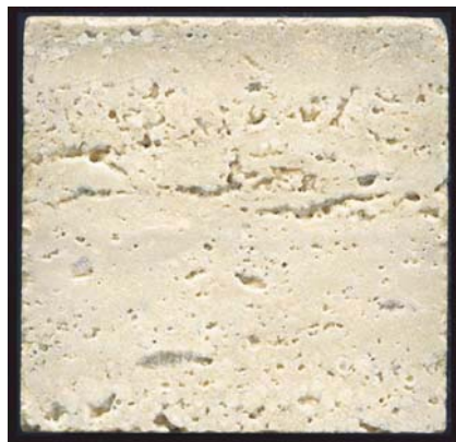
Fig. 2.- Muestra de Travertino Clásico (aristas de 5cm) con predominio de estructura criptobandeada, resaltada por porosidad fenestral.

Fig. 2.- Classic Travertine sample (5 cm edges) with predominance of a cryptolaminated structure, which is emphasized by fenestral porosity.