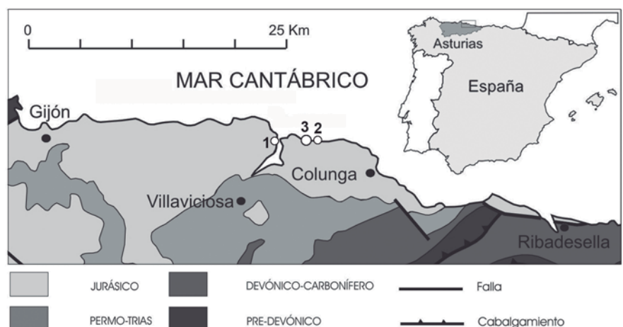
Fig. 1.- Situación geográfica y geológica de los yacimientos con restos de plesiosaurios del Jurásico Inferior de Asturias. 1: El Puntal-Tazones (Schulz, 1858), 2: Santa Mera (Bardet et al. , 2008a), 3: Villar (este trabajo). Modificada de Bardet et al. (2008a).

do en el «Charmouthiense»-Toarciense de Alhadas (distrito de Coimbra) y asignado a Plesiosaurus sp. por Sauvage (1897-1898: 21-22, lám 3, figs 1-3; Toarciense según Castanhinha y Mateus,