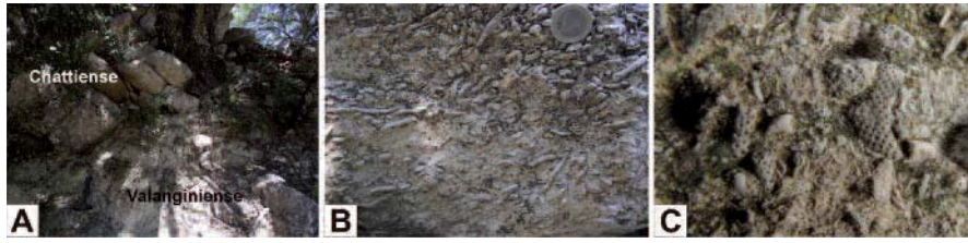
Fig. 2.- A) Vista en el afloramiento de las proximidades de la Fuenfría del contacto entre los materiales mesozoicos y cenozoicos; B) Vista de campo de las calciruditas y calcarenitas de briozoos con el detalle de los zoarios ramosos; C) Vista con la lupa de los briozoarios (longitud real de la foto en la vertical: 4 cm).