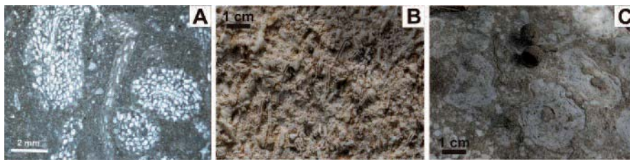
Fig. 3.- A) Lámina delgada de los briozoarios. Las zooecias están llenas de cemento esparítico. Predominan las colonias ramosas. en medio de la foto aparece un briozoo ciclostómid bifoliado. C) Vista de campo de las facies de foraminíferos y briozoos. D) Vista de campo de las facies de rodolitos.