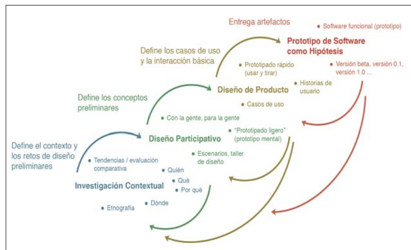
Figura 1. Proceso de diseño basado en la investigación.

Los resultados del diseño participativo se analizan en el estudio de diseño por los investigadores y se utilizan para crear los primeros prototipos que luego se prueban y validan de nuevo en las sesiones de diseño participativo. Al mantener una distancia de las partes interesadas, en la fase de diseño del producto, los investigadores en diseño tienen la oportunidad de analizar los resultados del diseño participativo, clasificarlos, utilizar el lenguaje de diseño específico relaciona-