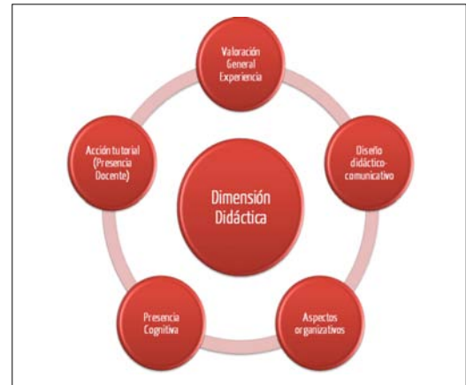
Figura 2. Dimensión didáctica.

En último lugar, se realiza el estudio evaluativo de la aplicación de la acción formativa para la conformación de la comunidad de práctica a través de entornos virtuales obteniendo tres dimensiones. En referencia a la primera dimensión, la «didáctica», el profesorado considera que los ejes claves del éxito han sido la participación, motivación y dinamismo de las estudiantes.