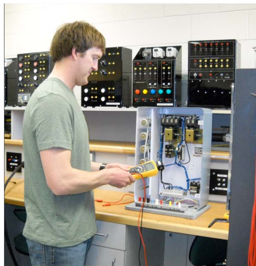
Estudiante del módulo de Electricidad en SAIT.

Durante la investigación ha quedado en evidencia la importancia del papel de los instructores en la experiencia docente. Los entrevistados en este proyecto señalaron el hecho de que los cambios en el aprendi-