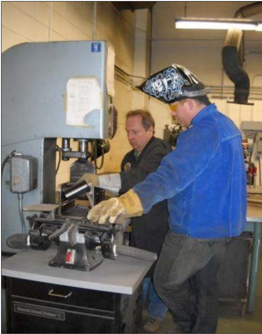
Estudiante del módulo de Soldadura en SAIT.

dante del programa de Soldadura con su formador mientras aprende a utilizar la maquinaria.