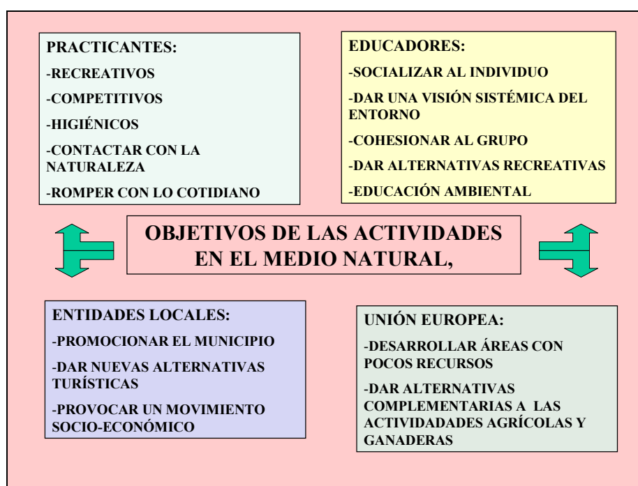
Figura 2.- Objetivos de las actividades en el medio natural (Fullonet, 1994:9).

Fullonet (1994) plantea objetivos a conseguir con este tipo de actividades, en función de los diferentes agentes que participan en el proceso formativo del sujeto. En la siguiente figura se exponen algunos de ellos: