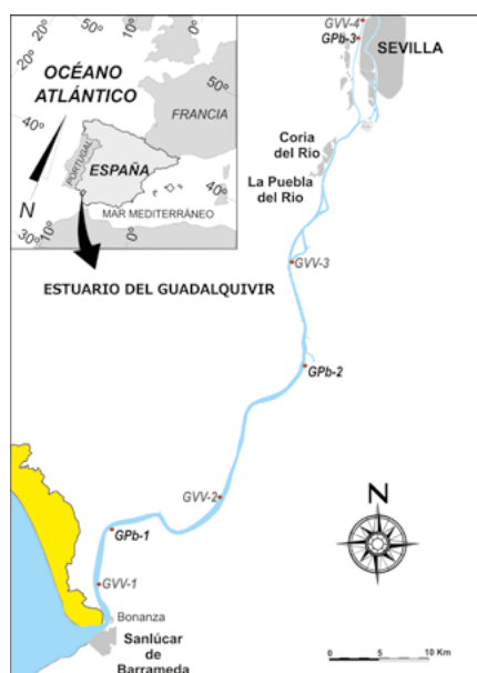
Fig. 1.- Localización de la zona de estudio con indicación de la posición de los sondes de sedimento datados por ^{14}\text{C} (GVV-1 a 4) y por ^{210}\text{Pb} (GPb-1 a 3).

Fig. 1.- Location of the study area with indication of the position of vibracores dated by using ^{14}\text{C} (GV-1 to 4) and by ^{210}\text{Pb} (GPb-1 to 3).