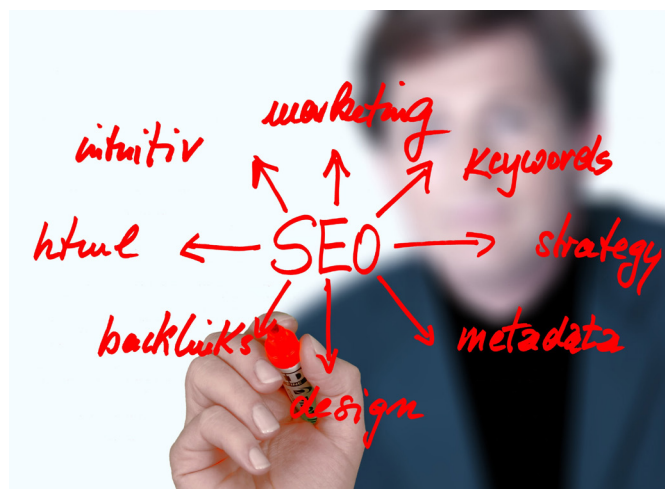
La difusión y visibilidad se incrementan mediante la indexación y enriquecimiento de los metadatos de los trabajos

> Servicios al investigador: valor ampliamente aceptado en los repositorios, como evidencia el criterio 8 que