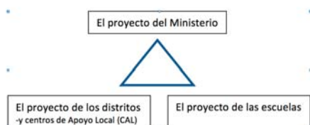
Figura 2 – El proyecto MINERVA y las partes que intervienen

Una lectura de este proyecto, a modo de resumen, fue hecha por Ponte (1994) conforme al centro de sus actividades, principalmente: al proyecto del Ministerio, al proyecto de los distritos y al proyecto de las escuelas