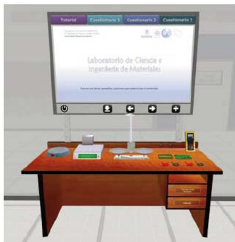
Figura 5. Puesto de prácticas donde se muestran los equipos para realizar las medidas de masa, longitud y eléctricas.

Los resultados que se esperan son afianzar conceptos prácticos y teóricos, relacionados con la asignatura de física (medidas de longitudes y masas, aplicación de la Teoría de Errores y medidas eléctricas), así como enseñar el correcto uso de los distintos equipos y herramientas de los laboratorios, como son la báscula, la balanza, el calibre y el multímetro.