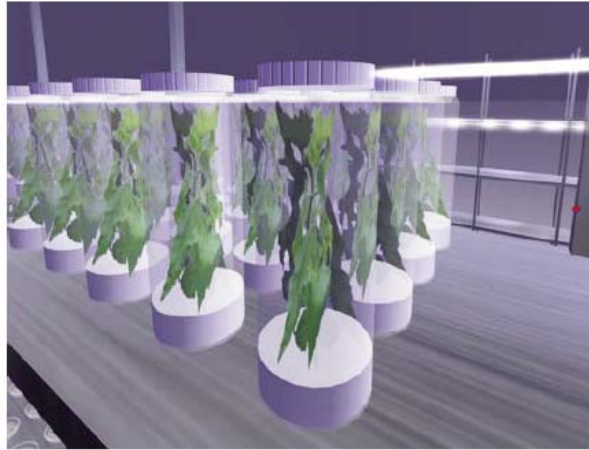
Figura 4. Chopos modificados genéticamente, en el Filotrón, sala con las características ambientales óptimas para su desarrollo.

En un entorno virtual se puede acelerar tanto como se desee, una reacción bioquímica o una prueba de laboratorio, así como el crecimiento del sistema vegetal, ya sea un árbol ó una planta herbácea, cuyo tiempo en la vida real puede variar de varios días a varios meses. Así el tiempo requerido para realizar la práctica que actualmente está en curso se estima en un total de dos años con un coste de aproximado de entre 15.000-25.000 euros por alumno mientras que en un entorno virtual se puede realizar en menos de una hora con un coste prácticamente nulo.