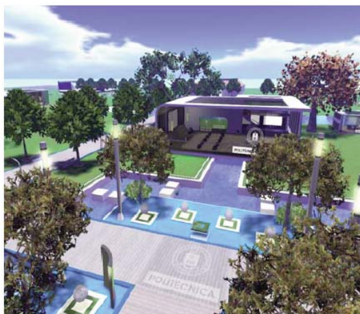
Figura 1. Región central de la plataforma GridLabUPM donde se hallan alojados los laboratorios del proyecto.

Al entrar en la plataforma o Grid, el avatar se encuentra con una región central de bienvenida, constituida por edificios centrales y un punto de encuentro virtual, así como con una región o isla por cada proyecto, donde, además de los laboratorios en los que se realizan las prácticas virtuales, el avatar puede desenvolverse e interaccionar con otros usuarios en espacios o salas virtuales de reuniones, salas de video y lugares de esparcimiento.