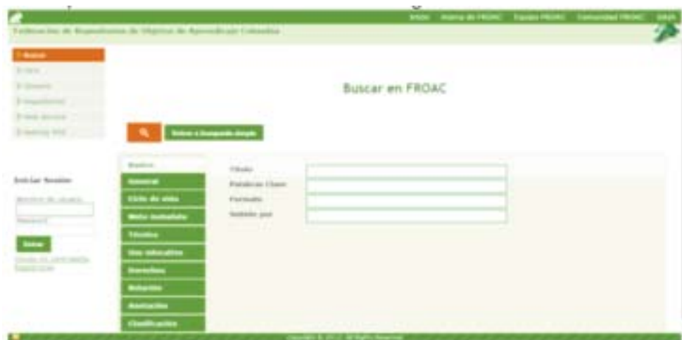
Figura 3. Opción de búsquedas avanzadas en FROAC.

Los dos componentes principales asociados a una federación son aquellos que permiten mecanismos para la gestión de la comunicación con los repositorios afiliados, y la búsqueda y recuperación de los OAs cosechados. A continuación se describen estos dos componentes principales: