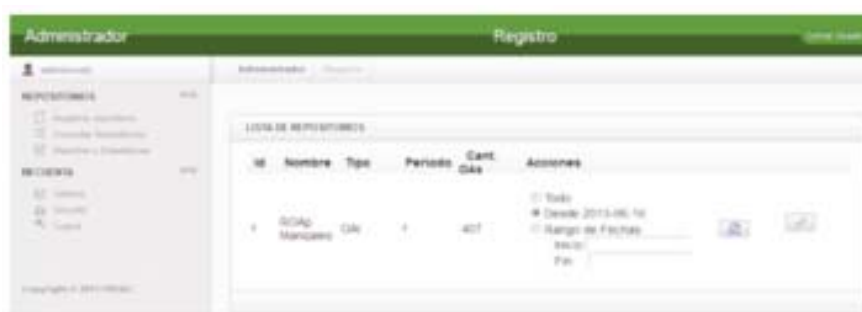
Figura 4. Administrador de Repositorios FROAC.

Existe una interfaz de administración, que se muestra en la Figura 4, a través de la cual se gestionan aspectos relacionados con los repositorios afiliados, como cantidad de objetos cosechados, edición de los datos asociados al ROA y administración de las actualizaciones. También existe una interfaz similar a la que pueden acceder los administradores de los repositorios afiliados, donde podrán encontrar información sobre el proceso de actualización y modificar algunas opciones relacionadas con sus repositorios. Este último aspecto es de gran importancia para la comunicación con los encargados de los ROA afiliados, ya que permite el apoyo por parte de estos en la identificación de algún problema presentado, y es posible ofrecer mayor información que aporta a la gestión de sus repositorios a través de las opciones adicionales que se ofrecen en FROAC.