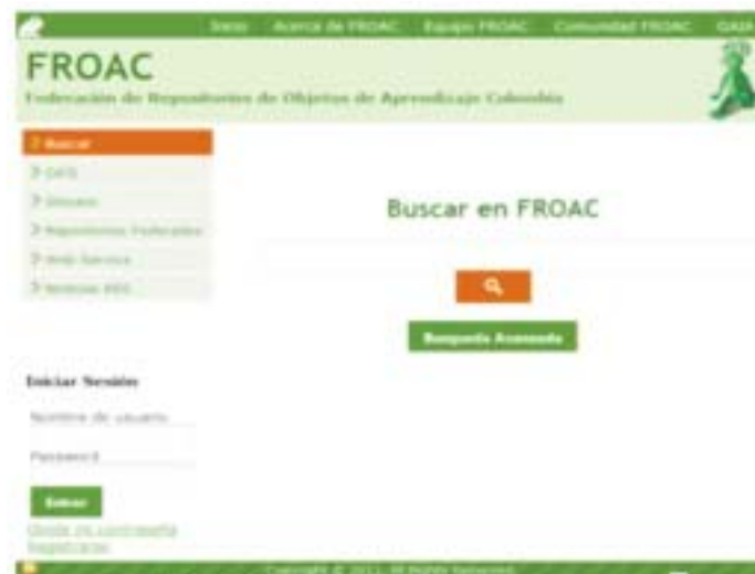
Figura 2. Interfaz principal de FROAC.

En la figura 2 se muestra la interfaz principal de FROAC a la cual se puede acceder a través de http://froac.manizales.unal.edu.co , en este sitio se podrán realizar búsquedas simples y avanzadas de los objetos de aprendizaje almacenados en los diferentes repositorios afiliados por medio de los metadatos cosechados, también se podrá acceder a los servicios adicionales con que cuenta la federación y se presenta información general asociada al proyecto.