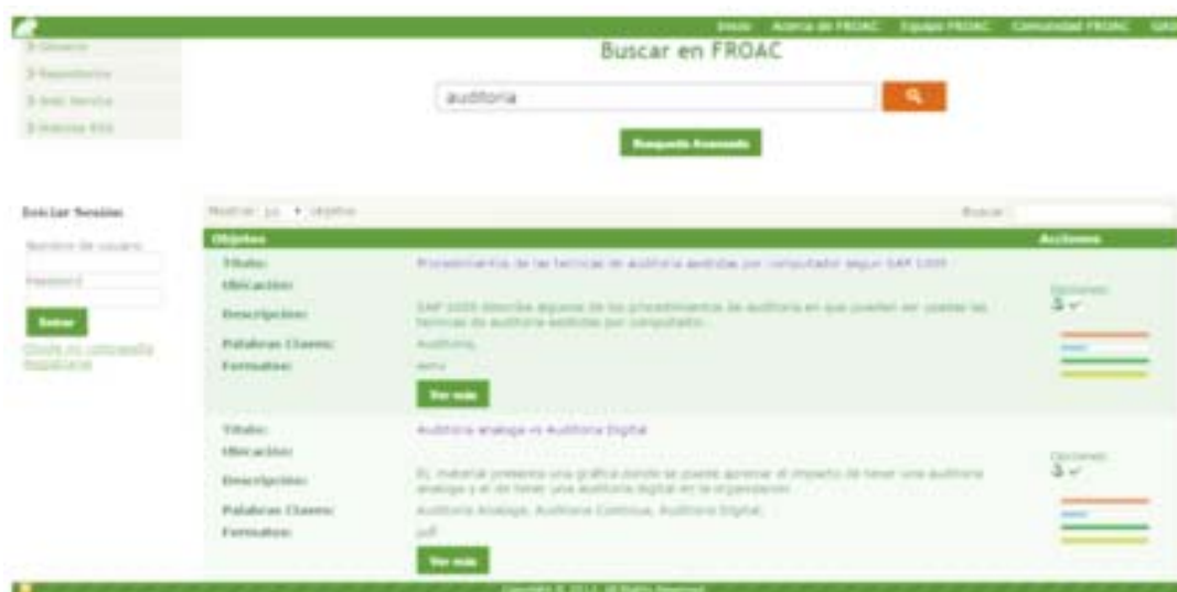
Figura 5. Resultados de Búsqueda en FROAC.

En la Figura 5 muestra la forma como son presentados los objetos a los usuarios.