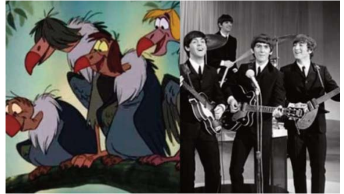
■ Figura 5. El libro de la selva. The Beatles

Si de guiños hablamos, uno de los más singulares se da en la versión de dibujos animados de «El libro de la selva» —estrenada en 1967—, en la que en un momento de la película aparecen cuatro buitres bastante inusuales posados sobre la rama de un árbol. Estos, con flequillos y peinados se asemejan a John Lennon, Paul McCartney, George Harrison y Ringo Starr, los componentes de la mítica banda inglesa The Beatles , que en el momento del estreno de esta película vivía uno de sus momentos de mayor auge. Figura 5,