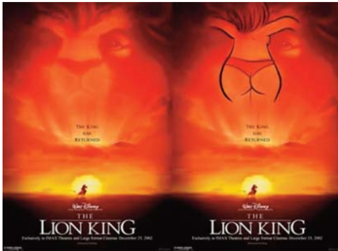
■ Figura 1. El rey León. Cartel