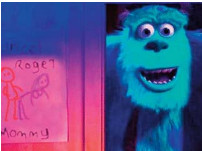
■ Figura 3. Monstruos S.A.

deza visual, ya que, a simple vista, puede pasar completamente desapercibido el cielo de estrellas que centra el plano de la secuencia mostrada sobre estas líneas. Tal y como aparecen ubicadas las estrellas, estas forman la palabra «SEX» (sexo). Aunque los productores de la película aseguraron que en lugar de «SEX», querían reflejar las siglas «SFX», como guiño al departamento responsable de los efectos especiales, en cualquier caso, es innegable que existía una clara intención de transmitir un mensaje oculto mediante la distribución o colocación de las estrellas que aparecen en la imagen. Figura 2