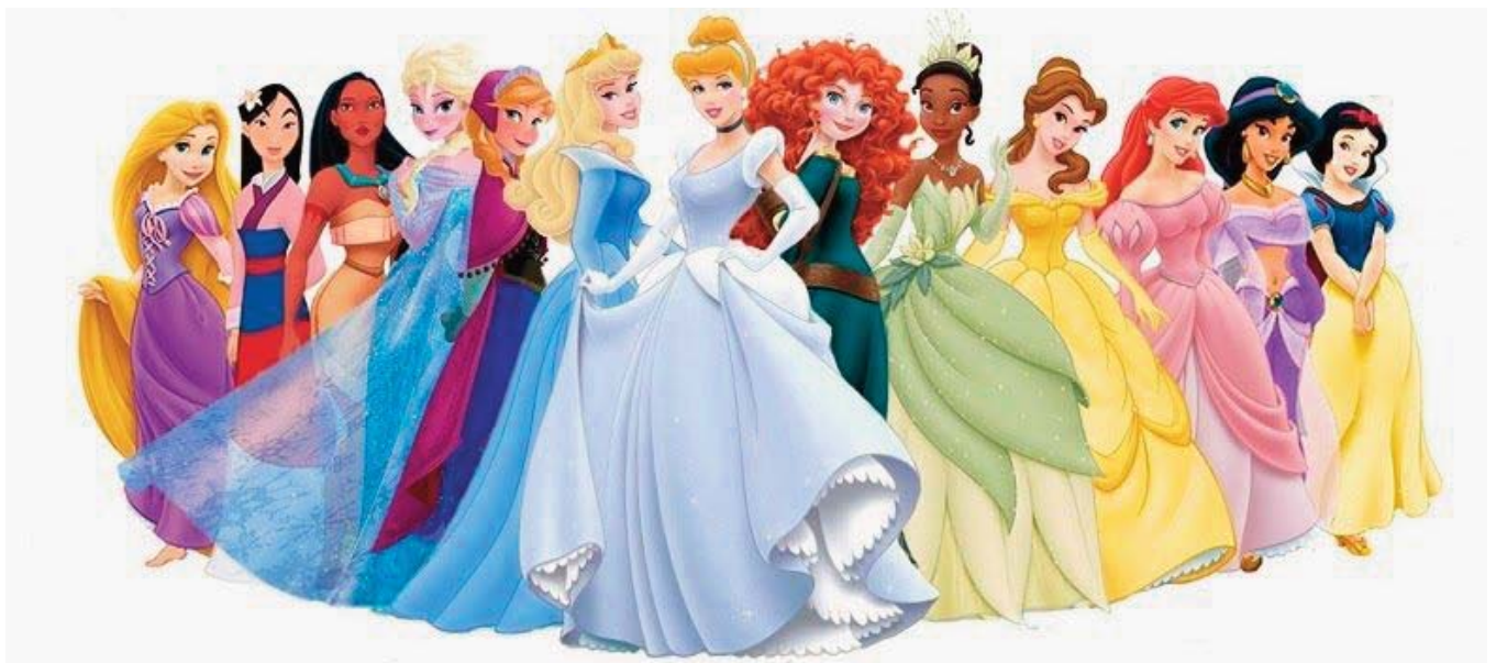
■ Figura 4. Princesas Disney

Por su parte, la segunda imagen es de la producción animada titulada «Monstruos S.A.». En la secuencia referida, se observa junto a la puerta una muñeca en el suelo. Esta no es otra que una réplica de la vaquera Jessie, de «Toy Story», ambas películas realizadas por la compañía Disney. Figura 7