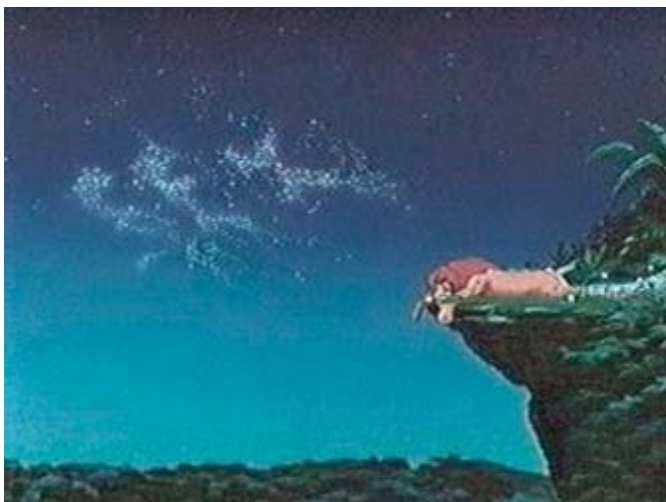
■ Figura 2. El rey León. Sex