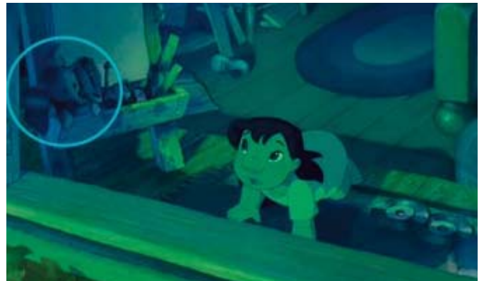
■ Figura 6. Lilo y Stitch

En este apartado se pueden ver dos ejemplos. El primero de ellos corresponde a la película «Lilo y Stitch», en la que la protagonista, la niña que da nombre a la película —Lilo—, tiene entre sus juguetes un peluche del elefante «Dumbo», en una clara referencia a la película del mismo nombre estrenada en 1941. Figura 6