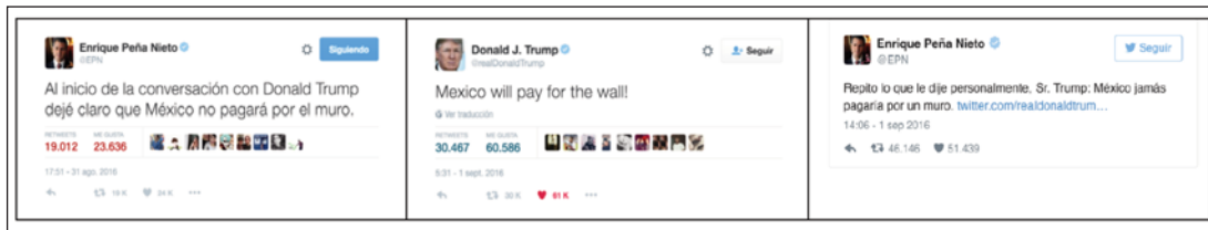
Figura 2. La disputa discursiva por el muro fronterizo.

cioso en eventos controversiales se articula de manera híbrida, es decir, redes sociales y medios tradicionales como la radio y la televisión.