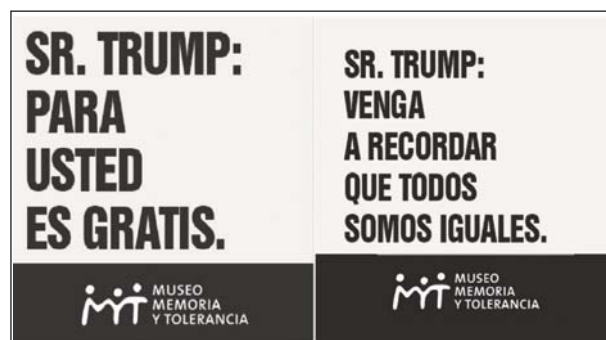
Figura 3. Recursos ciberculturales. Trump en México (Captura de pantalla de cuenta de Twitter del Museo Memoria y Tolerancia (2016, 31 de agosto).

Twitter es una red transnacional en la que los usuarios declaran el idioma en el que escriben por lo que la conversación se dividió en dos clusters. Para entender el sentido que los usuarios dieron a la conversación y el encuadre emocional detrás de la acción conectiva se realizó un muestreo aleatorio de 5.000 mensajes por cada idioma y se analizaron las narrativas temporales de Twitter bajo las siguientes categorías: burla, apoyo, repudio, sorpresa y tuit informativo. Se incorporaron «otro» e «insuficiente» para