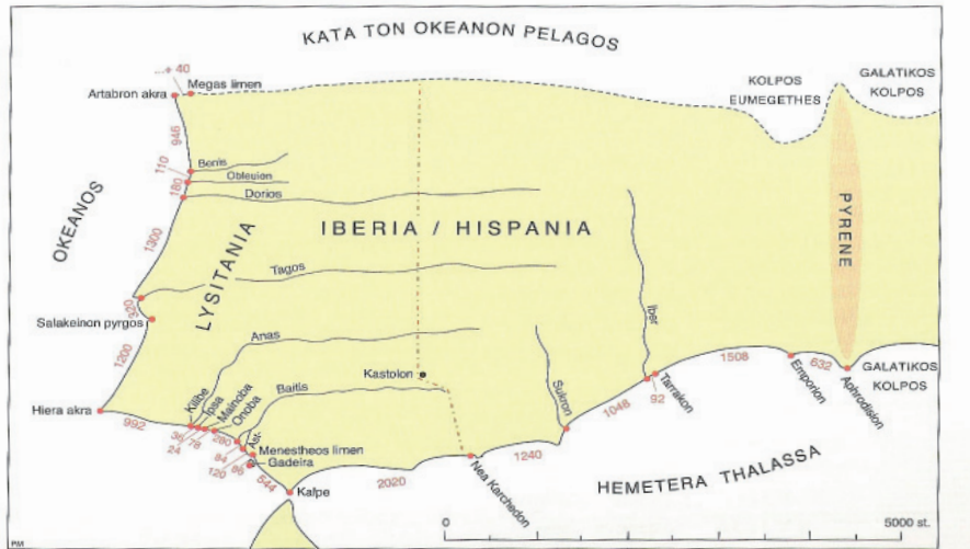
Fig. 2.1. La Península Ibérica segundo Artemidoro