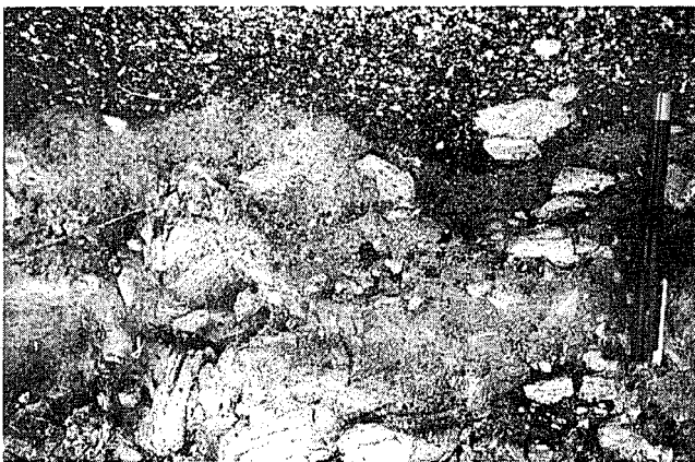
Fig. 4.— Depósitos generados por mud flows en Octubre de 1973, cubiertos por depósitos de canal.