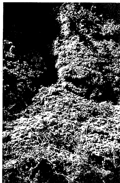
Fig. 1.— Talus cone generated in October 1989.