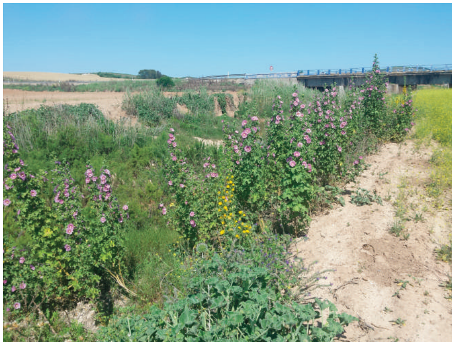
Figura 3. Rodal de Lavatera triloba entre el margen de un arroyo salado y el borde de un terreno de cultivo de secano en la campiña de Sevilla, Lebrija.