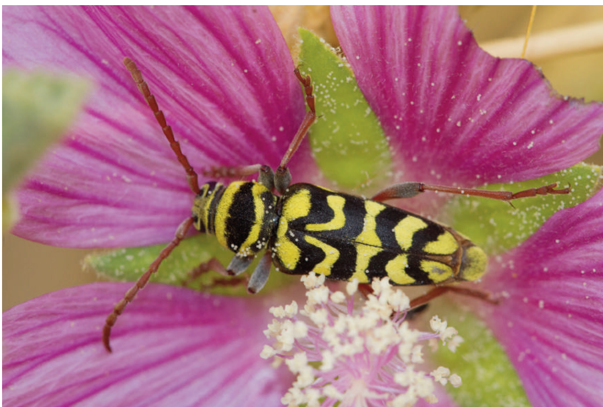
Figura 1. Plagionotus andreui sobre flor de Lavatera triloba en la localidad de Lucena del Puerto, primera cita para la provincia de Huelva.

La distribución actual de L. triloba el reflejo de la fragmentación del paisaje ocurrida durante siglos por la intensificación de la agricultura. En la actualidad las escasas localidades de presencia se encuentran restringidas a suelos gipsícolas o salinos, en bordes y taludes de caminos y carreteras o de cursos de agua o lagunas. Todos estos lugares son extremadamente vulnerables.