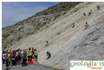
Fig. 1.- Fotografía de campo y logotipo del Geolodía - Granada de 2015 en la falla de Nigüelas.

Fig. 1.- Field photograph and logo of Geoloday - Granada of 2015 along the Nigüelas fault.