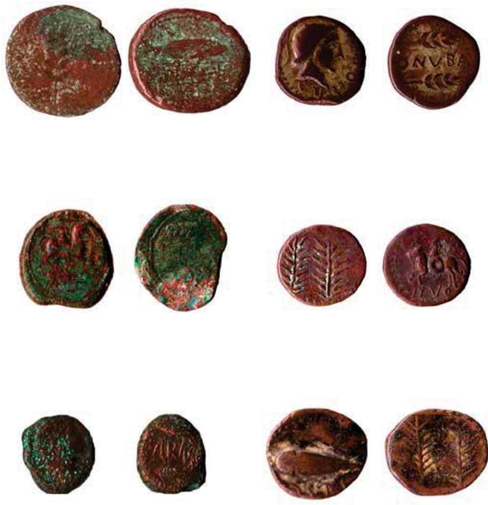
Figura 18. Conjunto Otras Iconografías.