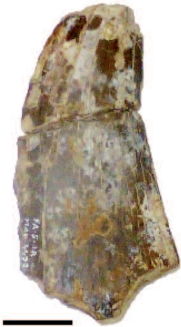
Fig. 2.- Diente de Megalosauridae indet. (MAP-4473) en vista lateral. Escala de 2 cm. La parte inferior es la descrita en Cobos et al. , (2014) y la parte superior la descrita en este artículo.

Fig. 2.- Tooth of Megalosauridae indet. (MAP-4473) in lateral view. Scale bar of 2 cm. The lower part was described by Cobos et al. (2014) and the upper part is described in this paper.