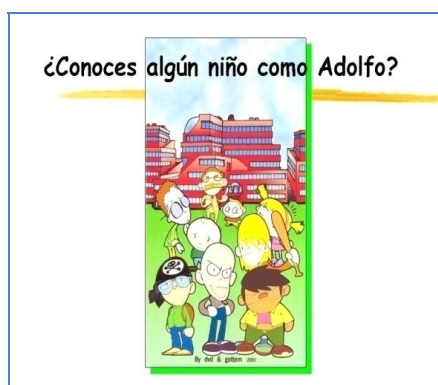
Fotograma de "¿Conoces a alguien como Adolfo?"

Tal como hemos indicado con anterioridad,