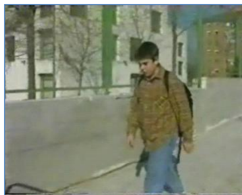
Fotograma de "Un día más"

d)Cualitativo para el profesorado grupos de discusión.