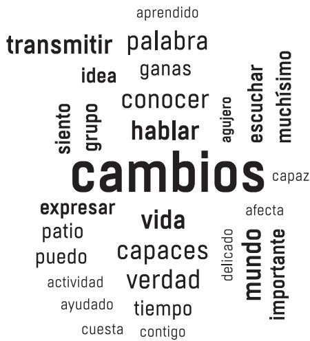
Figura 2. Cambios aportados por la realización de esta actividad para las personas presas