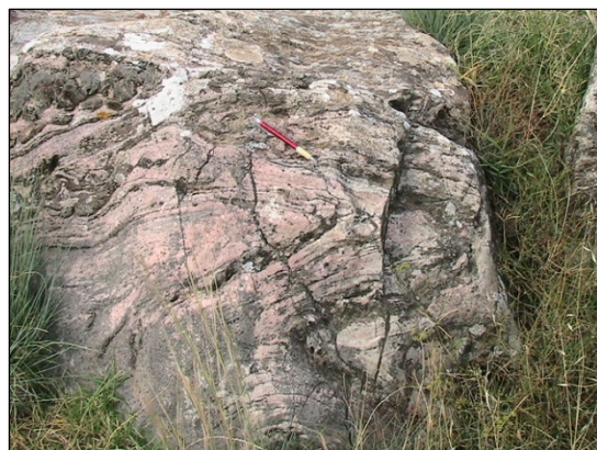
Figura 3. Pliegues apretados a isoclinales afectando a los mármol y a los niveles de rocas de silicatos cálcicos intercalados con ellos.

Las rocas que sufrieron estos procesos son de composición muy variada, y entre ellas encontramos mármol, producto del metamorfismo de rocas carbonatadas (calizas, dolomías) y rocas de silicatos cálcicos, producto probable del metamorfismo de margas o de complejas reacciones entre los carbonatos y niveles ricos en sílice intercalados con ellos. La distinta competencia -resistencia a la deformación- que muestran estos niveles alternantes dio lugar durante la deformación varisca a toda una variedad de estructuras que afloran de manera especialmente clara en el afloramiento de Aracena. Entre ellas, podemos citar: