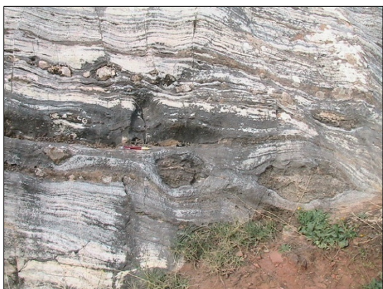
Figura 2. “Boudins” de rocas de silicatos cálcicos incluidos dentro de mármol.