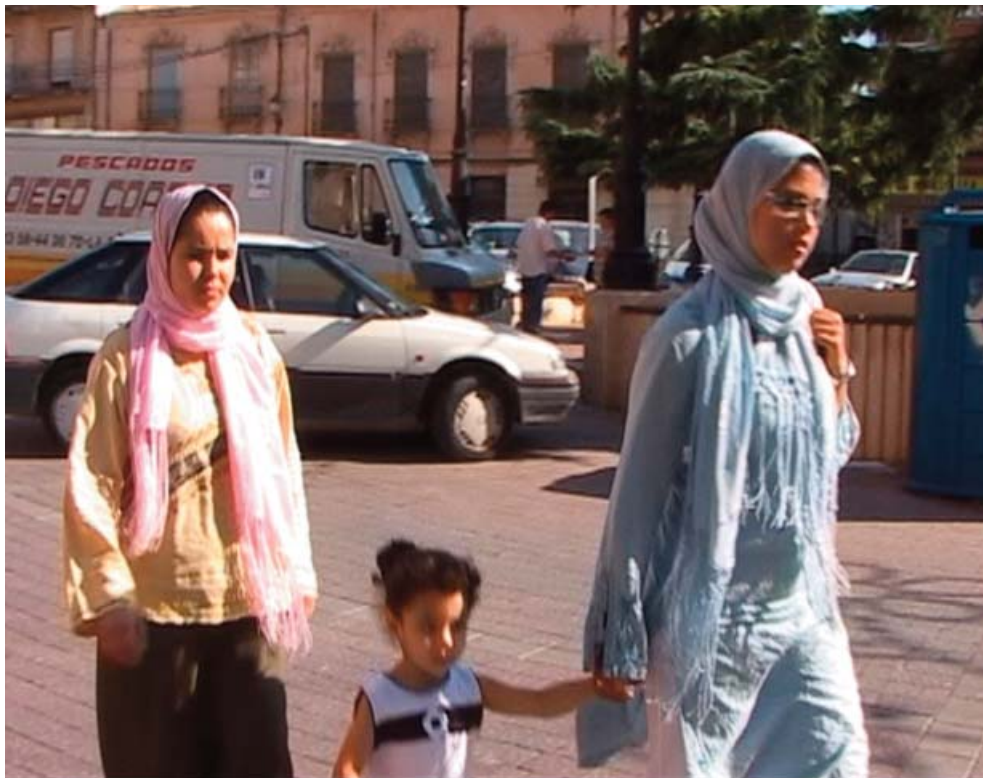
■ SIN RECORTES INMIGRANTES EN CASTILLA-LA MANCHA, ESPAÑA