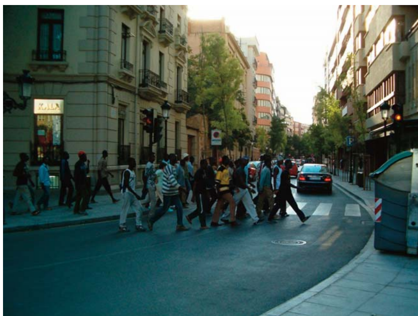
■ ÁFRICA LLORA AQUÍ AFRICANOS QUE MARCHAN A EUROPA