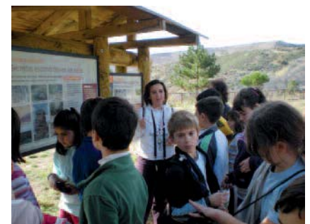
Fig. 2.- Explicación a un grupo de alumnos de la ESO en el Área experimental de Checa (Parque Natural del Alto Tajo)

Parada 1. Área experimental de Checa (Fig. 2): aquí podemos encontrar diferentes litologías presentes en el Parque Natural, un notable yacimiento de graptolitos (Calonge y Rodríguez, 2008), un interesante dropsstone , o un edificio travertínico en formación. Este espacio ha obtenido el reconocimiento del proyecto de la UNESCO Global Geosites como lugar de interés geológico internacional por sus excelentes condiciones para el estudio del Paleozoico Inferior (Carcavilla, 2007).