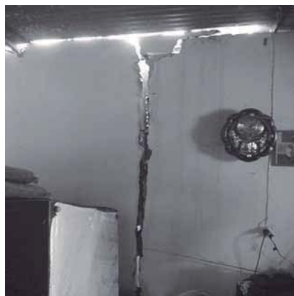
Fig. 5.- Agrietamiento en casas en el Sector de San Miguel.

Estructuralmente no se observan rasgos importantes debido al origen reciente