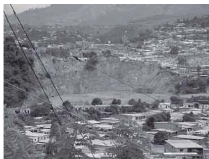
Fig. 4.- Colapso de taludes por socavación del nivel de base.

Se presentan como zonas aisladas a lo largo de los cursos del Motatán y Momboy, la zona de mayor área sirve de