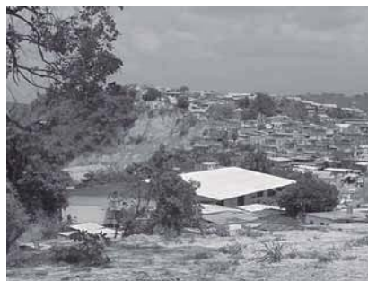
Fig. 2.- Derrumbes derivados de la fuerte intervención antrópica.

En general se puede decir, que el área dominada por esta unidad posee un potencial erosivo medio a alto en equilibrio precario, sometido a movimientos de masa localizados y erosión laminar, además con morfogénesis activada por intervención antrópica generalizada hacia las zonas de vertientes y fondos de valle. Como resultado de esto se ha producido en los últimos años el colapso de no menos de 80 viviendas en el sector La Floresta por alta concentración de aguas saturando el material ya descrito