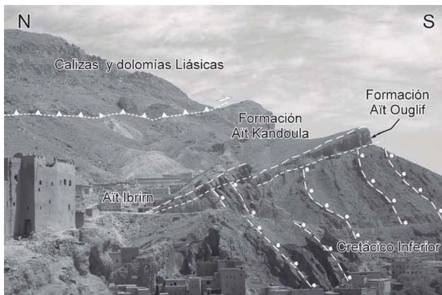
Fig. 4.- Discordancia de la formación Aït Ouglif sobre las areniscas del Cretácico inferior. Al norte se observa un cabalgamiento fuera de secuencia que hace emerger el Liásico del manto de Toundout, superponiéndolo a las formaciones Aït Ouglif y Aït Kandoula.

Fig. 4. - Image of the Aït Ouglif formation resting unconformably on top of folded lower Cretaceous beds. To the north, the Liassic of the Toundout nappe overrides the Aït Ouglif formation and overlying Aït Kandoula formation by an out of sequence thrust.