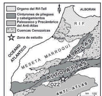
Fig. 1.- Esquema tectónico del norte de África mostrando la localización del área de estudio. OZZ = Cuenca de Ouarzazate.

La sucesión estratigráfica de la zona de estudio, respecto a su relación con la deformación principal Cenozoica, puede ser divididos en dos grupos: materiales pretectónicos y materiales sintectónicos, aunque hay una formación que puede si-