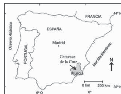
Fig. 1.- Situación geográfica de la zona de estudio

Bajo un punto de vista geológico nos encontramos en la Zona Subbética de la Cordillera Bética, muy cerca del contacto con la Zona Prebética, por lo que en la Rambla del Pizcalejo afloran profusamente materiales del Trías Keuper. Discordantemente sobre ellos tenemos una serie lacustre, donde aparecieron los restos fósiles, y dos niveles de conglomerados rojos poligénicos suprayacentes. Tanto los niveles lacustres como los primeros conglomerados (Q 1 ), paraconformes con los anteriores, presentan una dirección N50W y se ven afectados por suaves anticlinales y sinclinales, con buzamientos de 20° como máximo. Este plegamiento parece ser singenético con el depósito y producido por la acción halocinética del Trías, que lo limita por ambos flancos (Fig. 2). Igualmente, la acción combinada de la halocinesis y la incompetencia de los materiales lacustres hace que éstos se vean