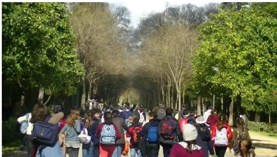
Fig. 2. Estudiantes de Educación Primaria realizando una actividad de salida académica en el contexto de un jardín de carácter histórico donde se incluyen el Museo Arqueológico y el Museo de Artes y Costumbres Populares de Sevilla, junto a diversos monumentos, posibilitando un tratamiento interdisciplinar de los contenidos objeto de enseñanza y aprendizaje (Parque de María Luisa, Sevilla)

Desde esta perspectiva y con la intención de profundizar en las necesidades de institucionalizar una línea de trabajo uniforme en el campo de la educación patrimonial, el Instituto del Patrimonio Cultural de España (perteneciente al Ministerio de Educación, Cultura y Deporte) ha diseñado el Plan Nacional de Educación y Patrimonio 1 . Este Plan incide en las necesidades que aquí planteamos, estableciendo como líneas prioritarias de actuación los programas de investigación en educación patrimonial e innovación en didáctica del patrimonio y formación de educadores, gestores y otros agentes culturales e investigadores en educación patrimonial. En estos programas se establece claramente la necesidad de incorporar las TIC en los nuevos modelos de enseñanza y aprendizaje, innovación de recursos y herramientas de interpretación patrimonial y la formación de los educadores (en el campo de la planificación de competencias, selección de contenidos relevantes, desarrollo de metodologías innovadoras, programación de actividades diversificadas, uso adecuado y coherente de recursos, gestión de los procesos de aprendizaje y su evaluación, siempre dentro del campo de interés patrimonial), incluyendo su coordinación con otros agentes que tienen el patrimonio como objeto de su labor profesional.