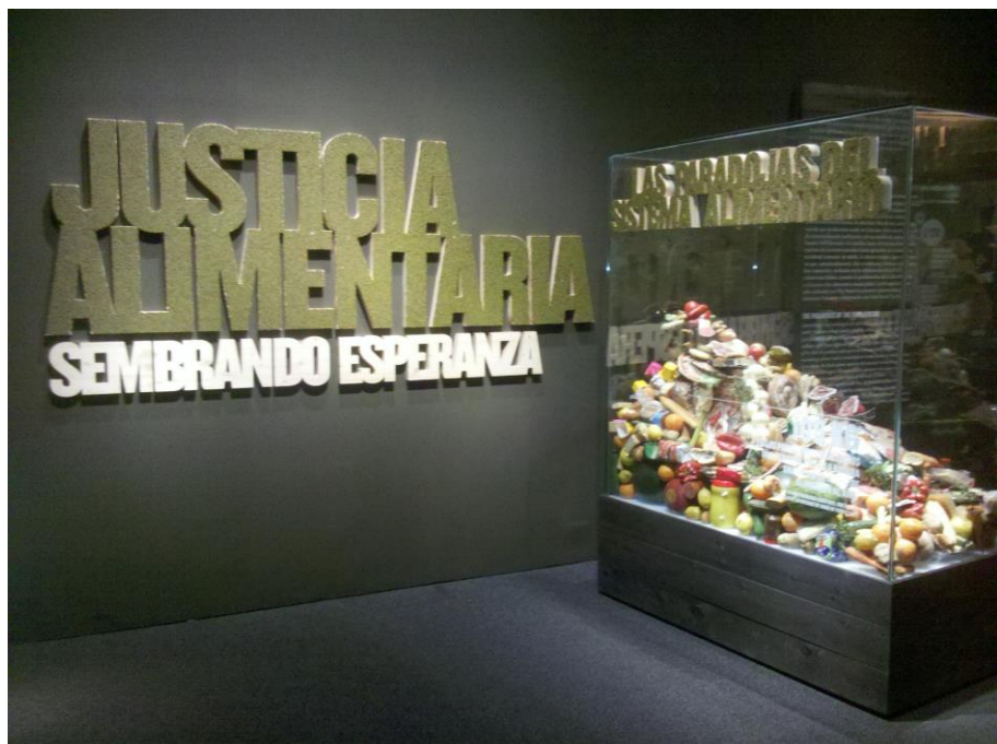
Fig. 3. Exposición en el que se emplean referentes patrimoniales como fuentes de información para explicar, desde posicionamientos sociocríticos, problemas sociales relevantes de la actualidad, como el desigual reparto de la riqueza, la pobreza y los consiguientes problemas de alimentación en el mundo (Exposición Justicia Alimentaria, Caixa Forum, Madrid)