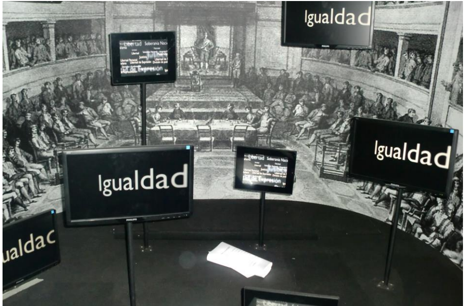
Fig. 4. Exposición para la conmemoración del II Centenario de la Constitución Española de 1812, destacándose los aspectos y avances más relevantes de este texto legal, que también podrían considerarse como referentes patrimoniales españoles y, por sus implicaciones, de la humanidad, asumiéndose como problemas relevantes de la actualidad (Exposición itinerante "Galeón La Pepa")

de educación patrimonial: epistemológica, didáctica, pedagógica y material. Por otro lado, investigaciones sobre el profesorado en formación inicial, tanto de educación primaria como secundaria, inciden en este tipo de problemas (CUENCA, 2002) que, por otro lado, pueden ser la base de las dificultades que los docentes en ejercicio encuentran para trabajar el patrimonio en sus aulas, según destacan otras investigaciones (ÁVILA, 2001; COHEN, 2003).