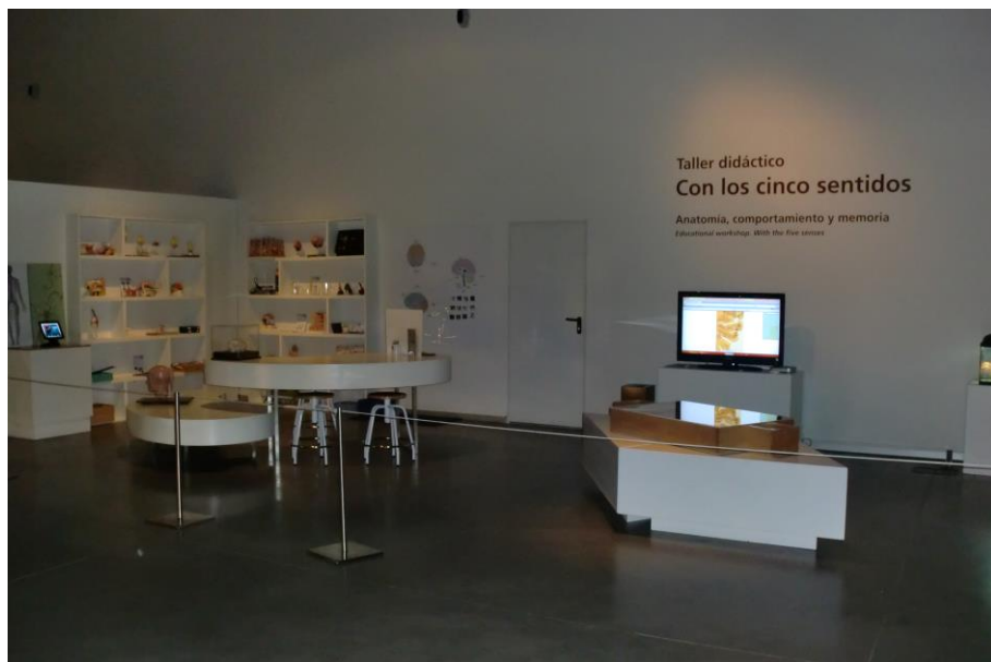
Fig. 1. Taller para el desarrollo de actividades en las que el alumnado desarrolla tareas con un importante componente procedimental (Taller "Con los cinco sentidos". Parque de las Ciencias de Granada)

Son de gran interés las propuestas de investigación del medio o su utilización como laboratorio para el aprendizaje sociocultural, empleando las visitas e itinerarios centrados en paisajes, edificios, museos, centros de interpretación de la naturaleza o lugares de interés medioambiental, con el fin de investigar, clasificar y conservar aspectos del patrimonio que pueden ser de utilidad para la práctica escolar a la hora de procesar información y nuevos conocimientos. Estas actividades deben imbricarse, antes y después de la salida, con tareas que lo contextualicen dentro de un diseño didáctico coherente y significativo. Las clasificaciones de minerales y fósiles, la realización de herbarios y de museos escolares con elementos de la vida cotidiana del pasado, el diseño de talleres tanto de creación plástica (maquetas, dibujos, croquis...) como de producción audiovisual sobre elementos patrimoniales, son ejemplos prácticos que dinamizan la vida escolar en el plano metodológico, al tiempo que configuran una nueva relación educativa con el patrimonio, motivadora para introducir al alumnado en todo tipo de conocimientos sociohistóricos y científico-naturales (Fig. 2).