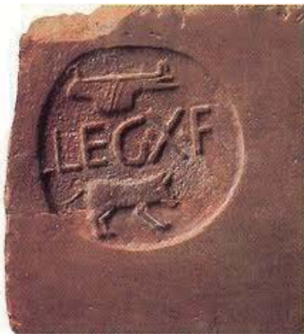
Fig. 3: Emblema de la X Legión.

la alusión a los dos mil cerdos del versículo 13 es una alusión a la participación de 2.000 soldados de la X Legión en la lucha contra los insurgentes judíos en el año 66 80 . Por otra parte, la ya mencionada presencia de un ala de auxiliares de la Legión III Gálica en Gerasa desde Vespasiano pudo contribuir a la inspiración del episodio marcano de la expulsión del demonio Legión, el demonio del ejército romano, es decir, la fuerza espiritual de la que se nutría y a la que adoraba el ejército romano, el águila imperial de las insignias que representaba a Júpiter-Zeus-Baal 81 . Para un lector judeocristiano, la expulsión de un demonio con nombre de unidad militar romana era una clara alegoría de lo que ocurriría con las tropas romanas cuando se produjese el Fin de los Tiempos y