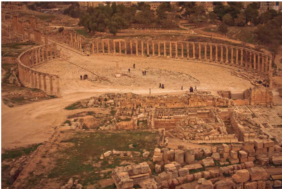
Fig. 2: Plaza oval de Gerasa, del siglo II d.C.

Los otros tres errores no pueden explicarse por la lectura de Plinio, pero son claras pruebas de que Marcos desconocía la geografía de la región. Esto no quiere decir que se la inventase, como pretende Zindler. Lo más probable es que Marcos hubiese oído en alguna parte -probablemente en los círculos judeocristianos- los nombres de las aldeas y ciudades que menciona.