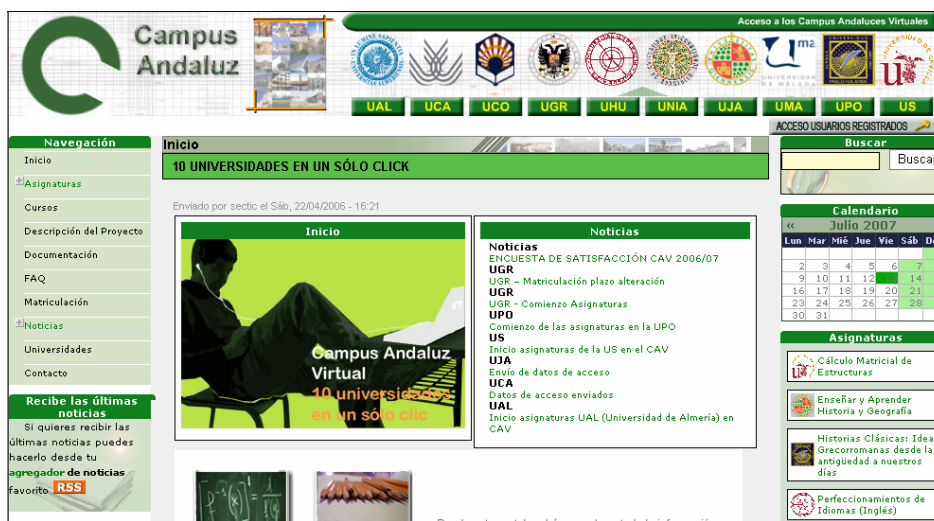
Imagen 1. Página de inicio del portal del Campus Andaluz Virtual.

Son múltiples los servicios que se pueden ofrecer desde cualquier sistema on-line. Un buen ejemplo de ello es el portal del CAV ( www.campusandaluzvirtual.com ) (Véase la imagen 1), en el encontramos un sitio web que sirve como punto de encuentro e información de interés general para todos los alumnos universitarios de Andalucía. Se creyó conveniente crear un portal de acceso único,