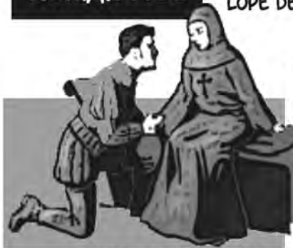
DON JUAN TENORIO