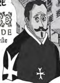
LOPE DE VEGA

ARTENVEVO DE hacer Comedias en este tiempo.