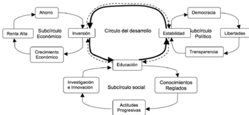
FIGURA 1: LOS CÍRCULOS DEL DESARROLLO

Una visión a largo plazo del crecimiento económico y del desarrollo sostenible lleva, inevitablemente, a tratar de la innovación y de los factores que la condicionan. Explicar el crecimiento económico de las naciones sólo es posible a través de los condicionantes económicos, políticos y sociales que resumen Fontela y Guzmán (2003) en tres círculos del desarrollo: económico, político y social (Figura 1).