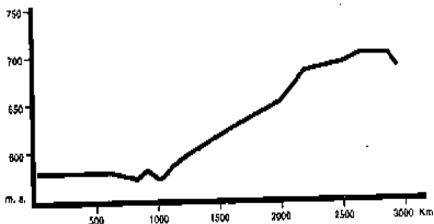
Gráfico nº 2. Arroyomolinos-Sierra de los Gabrieles.