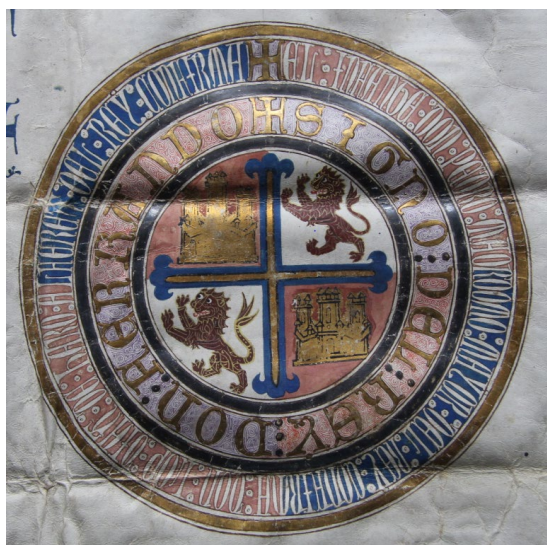
Figura 2. Rueda o signo del rey Fernando IV en privilegio rodado de 1310