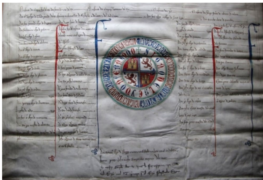
Figura 4. Parte validativa de privilegio rodado de Fernando IV (1295) con la rueda flanqueada por las columnas de confirmantes