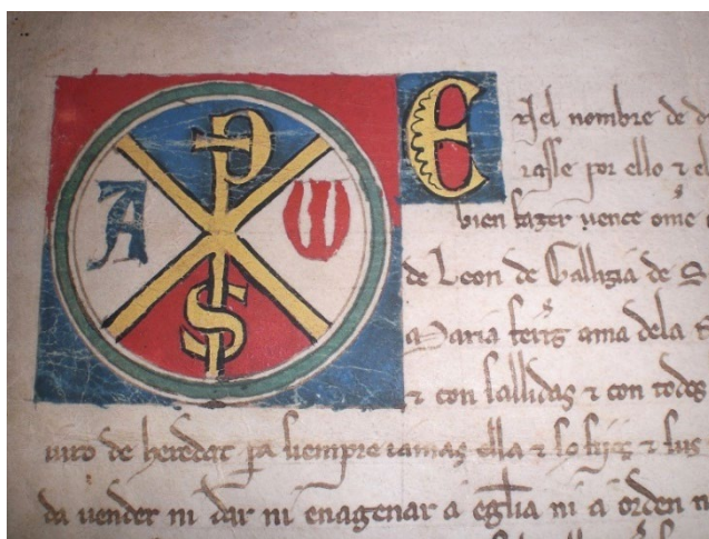
Figura 3. Crismón e inicial miniada de privilegio rodado de Sancho IV (1286)