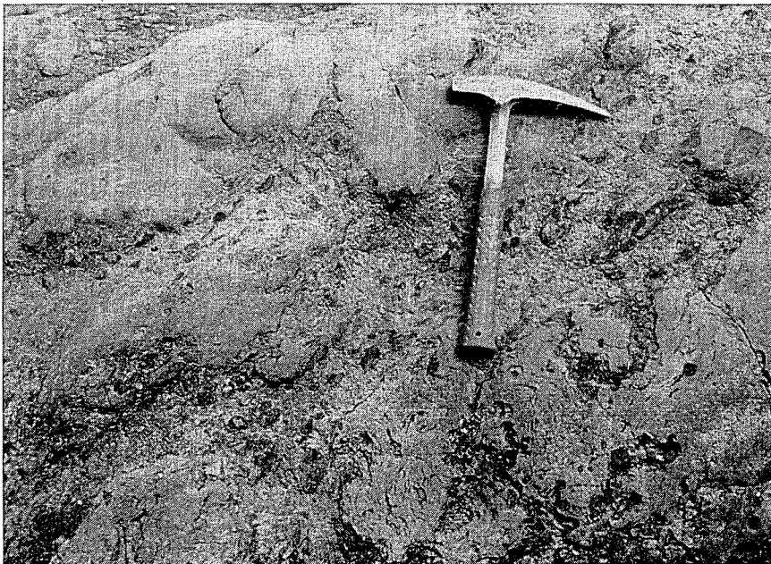
Fig. 3.—«Pillows» lobuladas empastadas en una matriz hialoclastítica y brechoide.

sobrepasan un milímetro, de plagioclasa (andesina) débilmente zonada, de oxihornblenda con inclusiones de opacos en el borde, y de augita ligeramente zonada. La matriz, tiene estructura traquítica bien desarrollada y está formada fundamentalmente por abundantes microlitos de plagioclasa, piroxeno, magnetita y algo de anfíbol. El accesorio principal, además de la magnetita, es apatito. La matriz, aunque de grano fino, tiene un grado elevado de cristalización, existiendo en ella muy poca fase vítrea.