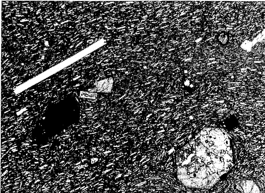
Fig. 4.—Traquibasalto: Fenocristales de plagioclase (blancos), piroxeno (gris) y anfíbol (oscuro) en una matriz traquífica microcristalina. L.N. x 25.