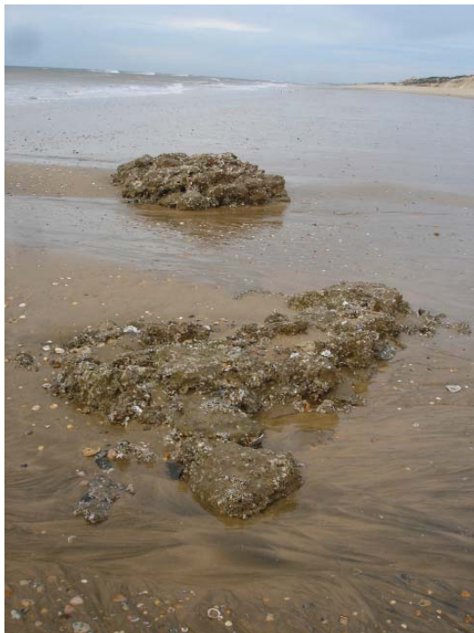
Figuras 5, 6, 7 y 8. Imágenes actuales que muestran los escasísimos restos visibles, aun con mareas muy bajas.