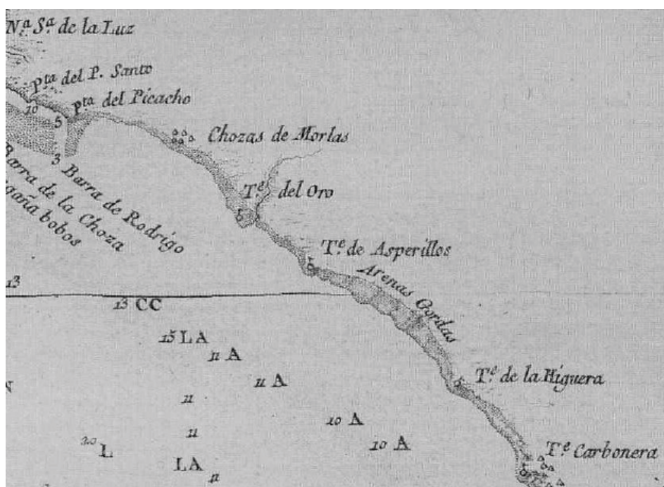
Figura 3. Detalle de la Carta esférica de la costa de España de Vicente Tofiño, 1786. La torre del Asperillo, entre las del Oro y la Higuera.

caracol de la escalera. Por su parte, los torreros continuaban ejerciendo sus funciones, aunque residían en una choza aledaña. La inutilidad de la atalaya la confirma otro informe militar, el firmado en 1821 por el ingeniero Joseph de Sierra, que la define como “arruinada, situada sobre una barranca arenisca que forma la playa, a 12 varas de altura; la mitad derribada por sus cimientos y cuarteado lo restante” (54). Parecido comentario realiza el mismo ingeniero en otra relación correspondiente al año 1829, cuando la define como “arruinada (...) sobre un ribazo arenisco que forma la playa donde empieza esta a estrechar” (55). Y similar valoración merece para Sebastián de Miñano, que en su diccionario de 1827 la encuentra en pésimo estado “sobre una barranca de arena voladera”. Añade también Miñano una mención al constante retroceso del acantilado, afirmando de la atalaya que “en su fundación distaba 125 varas del agua; pero la continuación de los temporales y resacas ha descarnado tanto aquella costa que la torre se halla ya amenazando ruina” (MIÑANO Y BEDOYA, 1827: 257).