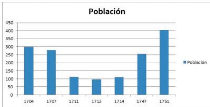
Figura 3. Gráfica de la población de la villa según censos coetáneos.

de la Ensenada de 1752 nos presenta una población de 403 vecinos 31 . El siguiente gráfico muestra, a modo de resumen, los niveles de población por vecinos durante los años previos, coetáneos y posteriores a la guerra.