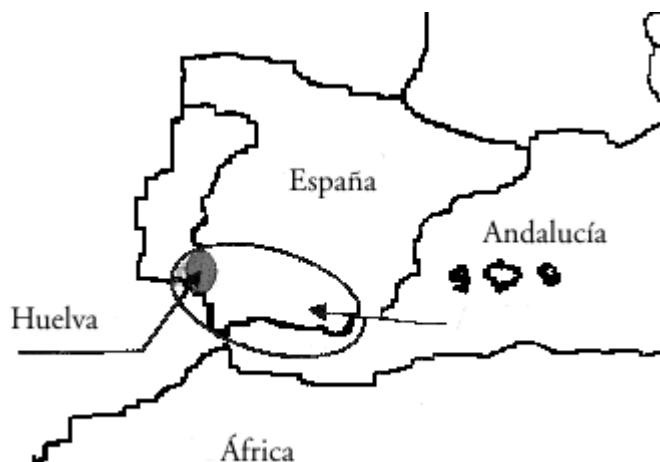
Mapa 1. Ubicación de Huelva en Europa.

La utilización de la tecnología, así como los recursos naturales existentes, resulta imprescindible para entender el desarrollo de esta revolución agraria, ya que la nueva agricultura a la que nos referimos surge, sobre todo en el litoral onubense, en los campos de arena, en zonas poco propicias para las actividades agrícolas. Su ubicación demanda, pues,