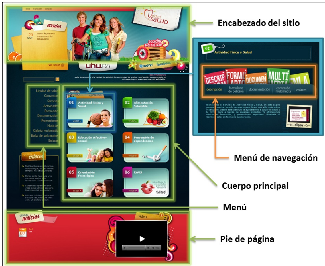
Figura 1.- Descripción de las diferentes partes del diseño de la página principal del sitio web de la “Unidad de Salud” y el apartado de “Actividad física y Salud” ( www.unidadsalud.es ).

promotor de la salud de la comunidad universitaria, capaz de actuar además como puente para impregnar a la sociedad en su conjunto, respondiendo a que una educación deficiente en cuestiones de salud se asocia a pobres resultados de salud en dicha población, tal y como argumentan Choi y Bakken (2010).