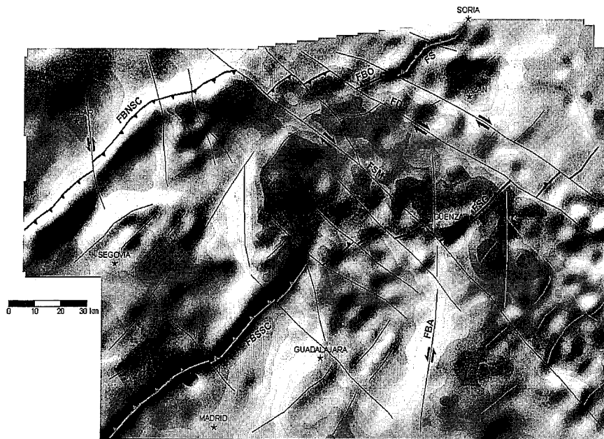
Fig. 3.- Sombreado artificial del mapa de anomalías de Bouguer. En él se han representado las principales fallas asociadas a los gradientes. FBNSC: Falla del borde norte del Sistema Central. FBSSC: Falla del borde sur del Sistema Central. FSM: Falla de Somolinos. FG: Falla de Gormaz. FD: Falla del Duero. FSL: Falla de San Leonardo. FS: Falla de Soria. FSG: Falla de Sigüenza.

Fig. 3.- Artificial shading image of the Bouguer Anomaly Map. Main faults related to gradients are showing. FBNSC: Spanish Central System Northern Border Fault. FBSSC: Spanish Central System Southern Border Fault. FSM: Somolinos Fault. FG: Gormaz Fault. FD: Duero Fault. FSL: San Leonardo Fault. FS: Soria Fault. FSG: Sigüenza Fault.