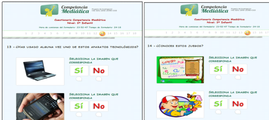
Figura 6. Visualización de los ítems 13 y 14.