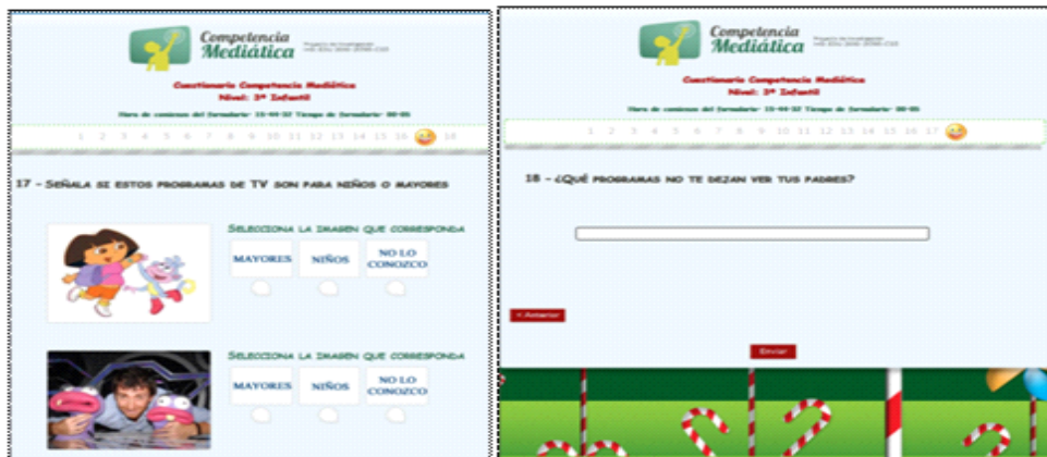
Figura 8. Visualización de los ítems 17 y 18.