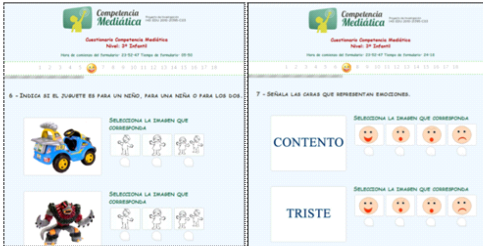
Figura 2. Visualización de los ítems 6 y 7 del cuestionario temático.

Para comenzar, describimos de forma gráfica en la Tabla 1, la relación de cada uno de los ítems que conforman el cuestionario con cada una de las dimensiones que contemplamos en la definición que hemos ofrecido sobre competencia mediática.