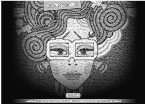
Portada de la ludoteca virtual

La página madre o principal (home) está constituida por una parte textual y otra gráfica. La primera ofrece una breve descripción del proyecto y la segunda es un conjunto de receptáculos que contienen los recursos educativos. En la parte superior, aparece una serie de pestañas que ofrece al usuario una especie de índice (figura 2). Desde la «Ludoteca» se accede a toda la gama de recursos de la misma forma que desde cada uno de los receptáculos. En la pestaña «Proyecto» el usuario tiene acceso a la descripción más completa de la propuesta y de las entidades que colaboran, así como la relación de las personas que han