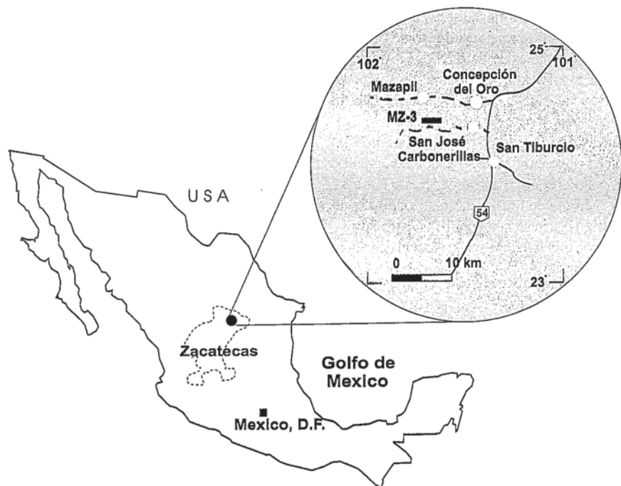
Fig.1.- Localización del perfil MZ-3 en el cañón de San Matías (Zacatecas, México)

Estudios significativos sobre los bivalvos del Jurásico superior en México se iniciaron con los datos aportados por Del Castillo y Aguilera (1896) referentes a los géneros Aucella , Cucullaea , Trigonia , Exogyra y Lucina . Pavlow (1907) realizó la primera revisión monográfica de los bivalvos recolectados por Aguilera (en Aguilera et al. , 1896) y reconoció la presencia de Aucella bronni , A. pallasii , A. tenustriata , A. fischeriana , A. terebratuloides y A. volgensis , especies que asignó al Kimmeridgiense-“Portlandiense” inferior. Posteriormente, Burckhardt (1930) ofreció una valiosa síntesis, a la vez taxonómica y estratigráfica, de los bivalvos del Oxfordiense ( Pholadomya , Pleuromya , Trigonia , Gervillia , Astarte y Opis ), Kimmeridgiense (“Banco de Aucellas ”, con Aulaconmyella ) y “Portlandiense” ( Cucullaea phosphoritica y Lucina sp.). Imlay (1940) describió los bivalvos del Jurásico superior de México y proporcionó una base de datos de referencia. Alencáster y Buitrón (1965) centraron sus investigaciones en la correlación de las asociaciones de bivalvos y en la interpretación de sus ubicaciones relativas respecto a las facies costeras durante el Jurásico tardío en el centro-Este de México. Alencáster (1984) interpretó la procedencia tethy-